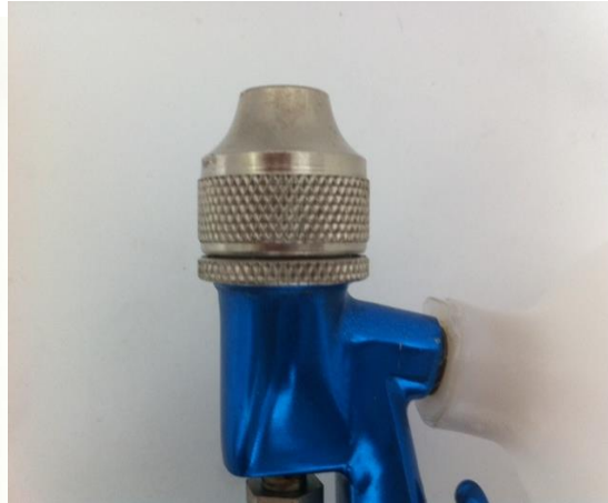
Rosca do espalhador