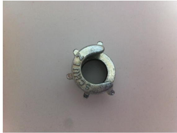
Este é o anel de vedação